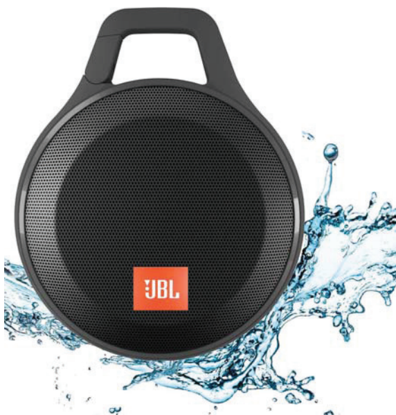
» Karabínka v hornej časti umožní uchytenie hlavne na oblečenie

Dizajn je zameraný na čo najmenšie rozmery a vysokú prenosnosť. Reproduktor sa vyrába až v ôsmich farebných variantoch, má kruhový tvar a okrem prednej kovovej mriežky je celé jeho telo pogumované.