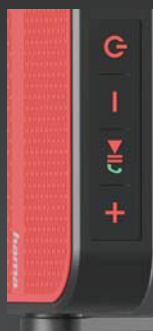
» Množstvo ovládacích prvkov výrobcu minimalizoval

Na modeli Blade pri prvom pohľade upúta príjemný dizajn v štýle retro. Plastové držadlo, ktoré možno nastavovať, je v kĺboch veľmi pevné, a tak ho môžete využiť ako rúčku pri prenášaní, ale aj ako stojan na reproduktor v polohe rádia. V druhom prípade si sklon reproduktora prispôbíte svojim aktuálnym požiadavkám skokovo otáčaním o 360°. Ovládanie sa scvrklo na štyri tlačidlá a musíme konštatovať, že to vôbec neprekáža a nič významné nám nechýbalo. Tlačidlo na spúšťanie a zastavovanie prehrávania slúži zároveň na prijímanie hovorov. Informačná LED je umiestnená v pravom hornom rohu prednej časti, kde ju dobre vidno.